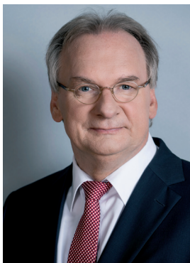
Dr. Reiner Haseloff Mdl Ministerpräsident des Landes Sachsen-Anhalt Magdeburg, Januar 2020